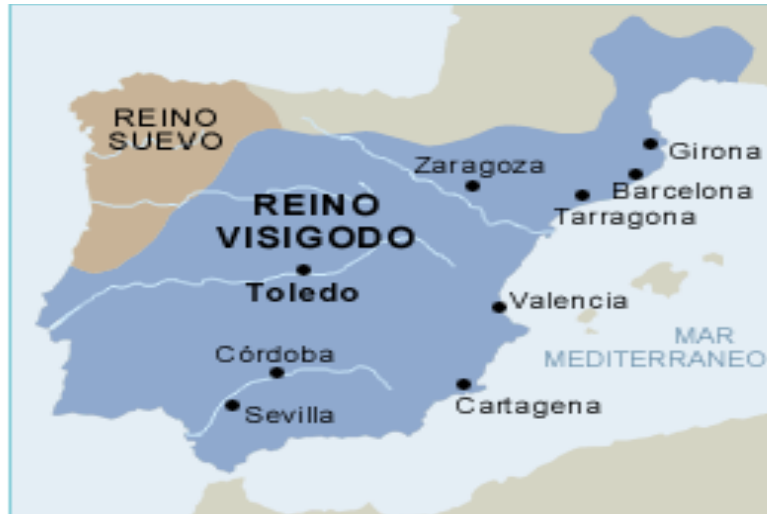
Reino Visigodo de Toledo

Recesvinto (649-672), que unificó todas las leyes del reino en el Fuero Juzgo .